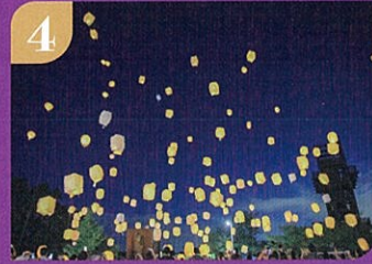
4 ランタンを打ち上げ彩りを描く。