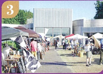
3 マルシェで賑わいを楽しむ。