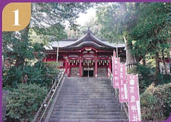
1 高瀧神社でお参りし提灯を受け取る。市原湖畔美術館までゆったり歩く。

高瀧神社や市原湖畔美術館に設置されているスタンプを5個押して、手持ち花火を手に入れよう! 指定会場にて花火が行えます。