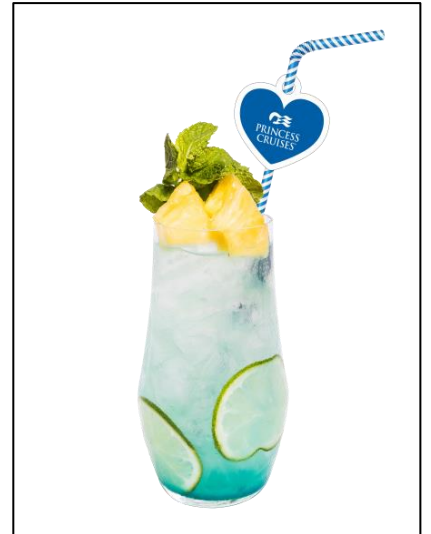
プリンセス・クルーズ 会場限定オリジナルカクテル（イメージ画像）

プリンセス・クルーズ は、2018年8月4日（土）、横浜赤レンガ倉庫にて「プリンセス・クルーズ presents フォトジェニックスポット in 横浜赤レンガ倉庫 Red Brick JOURNEY」を開催します。これは横浜赤レンガ倉庫が7月28日（土）から8月26日（日）までイベント会場を実施する「Red Brick JOURNEY」（レッドブリックジャーニー）内で開催されます。ダイヤモンド・プリンセスが母港である横浜港の大きな橋国際客船ターミナルに寄港する8月4日、横浜赤レンガ倉庫からダイヤモンド・プリンセスを絶好の位置からご覧いただける場所にフォトジェニックスポットを設置します。スポットで撮影した写真を指定のハッシュタグをつけてInstagramに投稿すると、抽選で船内見学会やプリンセス・クルーズオリジナル・グッズが当たる他、会場でメールマガジンにご登録された方には、会場限定のオリジナルカクテル*を先着1,000名様にプレゼントします。