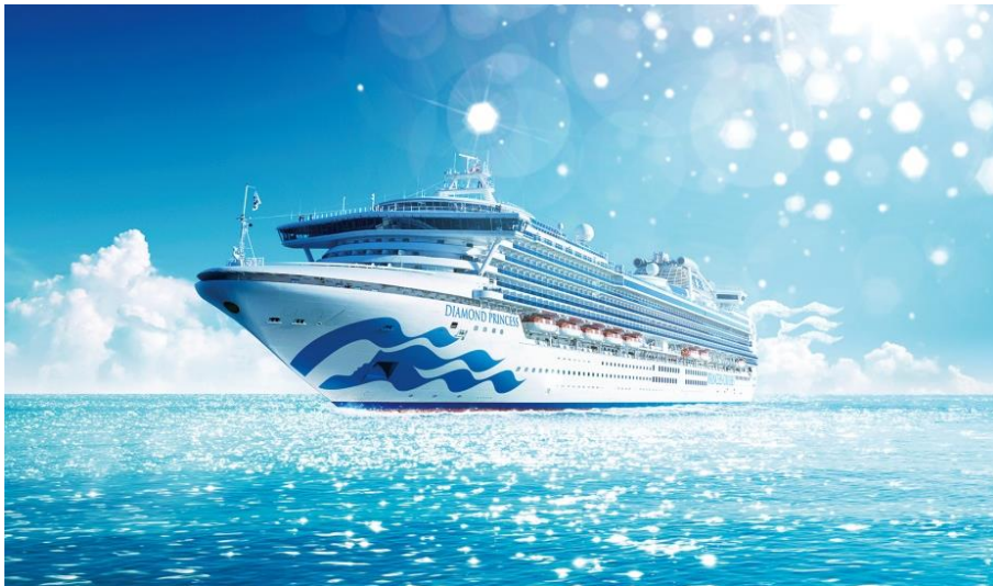
ダイヤモンド・プリンセス

～ダイヤモンド・プリンセスを背景に写真を撮ってInstagramに投稿すると船内見学会などが当たる他、 メールマガジン登録で会場限定オリジナルカクテル*を先着1,000名様にプレゼント！～