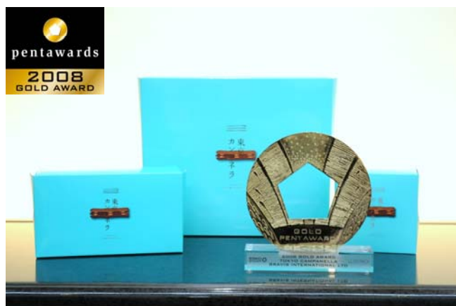
Packaging design by Bravis International Ltd

「東京カンパネラ」ショコラは、2007年3月8日の東京駅構内(南通路店:丸の内南口に向かう通路沿い左手)での発売当初から、三層構造という画期的なお菓子のかたちと、開放的で鮮やかな東京をイメージした「東京カンパネラ・ブルー」に注目が集まり、昨年8月に実施した東京駅構内での催事では、期間内歴代最大級の販売実績を残しました。