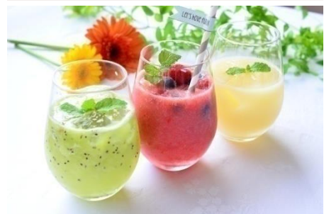
<お料理イメージ画像>