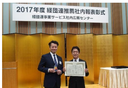
〈3月13日の授賞式の様子〉

「経団連推薦社内報審査」は、経営に真に役に立つ社内広報活動の推進とともに、日頃の活動を評価・奨励することによって、社内報のレベルアップを図ることを目的に1966年に創設されたものです。各社内報が的確な発行目的・編集方針を持ち、それがどれだけ実現しているかについて、多角的な審査基準に則って評価されます。