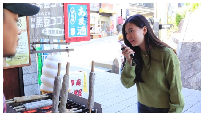
▲旅行先の人たちとのコミュニケーションが「ili (イリー)」でスムーズに