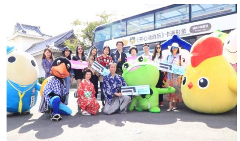
▲プロモーション初日のセレモニーの様子

※1 2017年WILLER調べ ※2「ili(イリー)」は株式会社ログバーの商標または登録商標です。