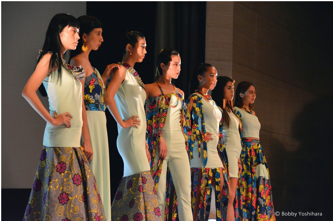
アフリカ各国の日本では知られていない魅力を、日本のアフリカ無関心層に届けることを目的としたファッションショー、ファッションイニシアティブ。2016年に最初のショーを行い、それ以外数多くのファッションショー、イベントをプロデュース。

て、アフリカの多様性や魅力を伝えることで、アフリカ関連のブランドが、「かわいそうだから」買われるのではなく「魅力的だから」買われるように日本に住む多くの人たちの意識を変えるべく、奔走してきました。