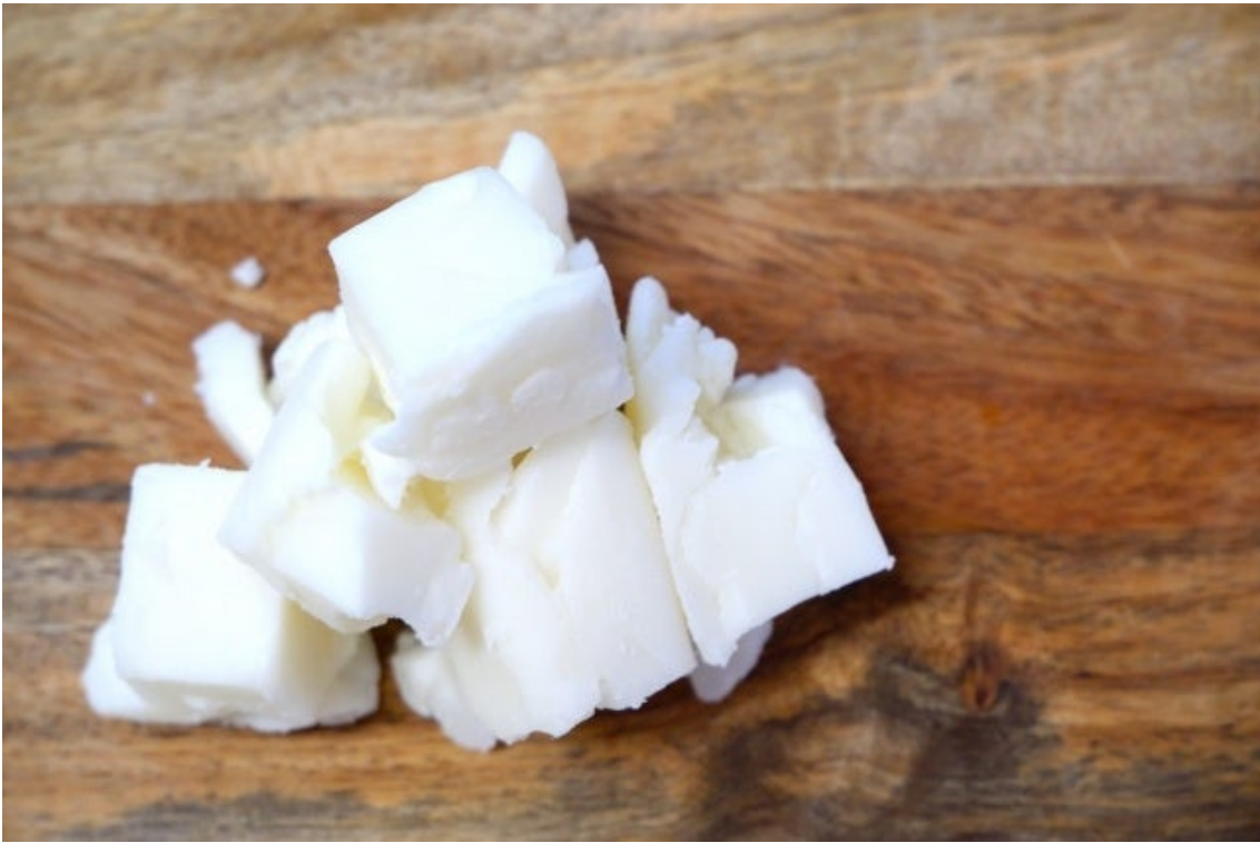
水溶性の保湿成分「シアバターアクア」を使用。

また、アフリカ・マダガスカルの高品質なエッセンシャルオイル（精油）を使用。「ゼラニウム＆ローズマリーベルベノン精油の香り」「イランイラン＆ヘリクリサムフィメール精油の香り」の2種類から選べます。