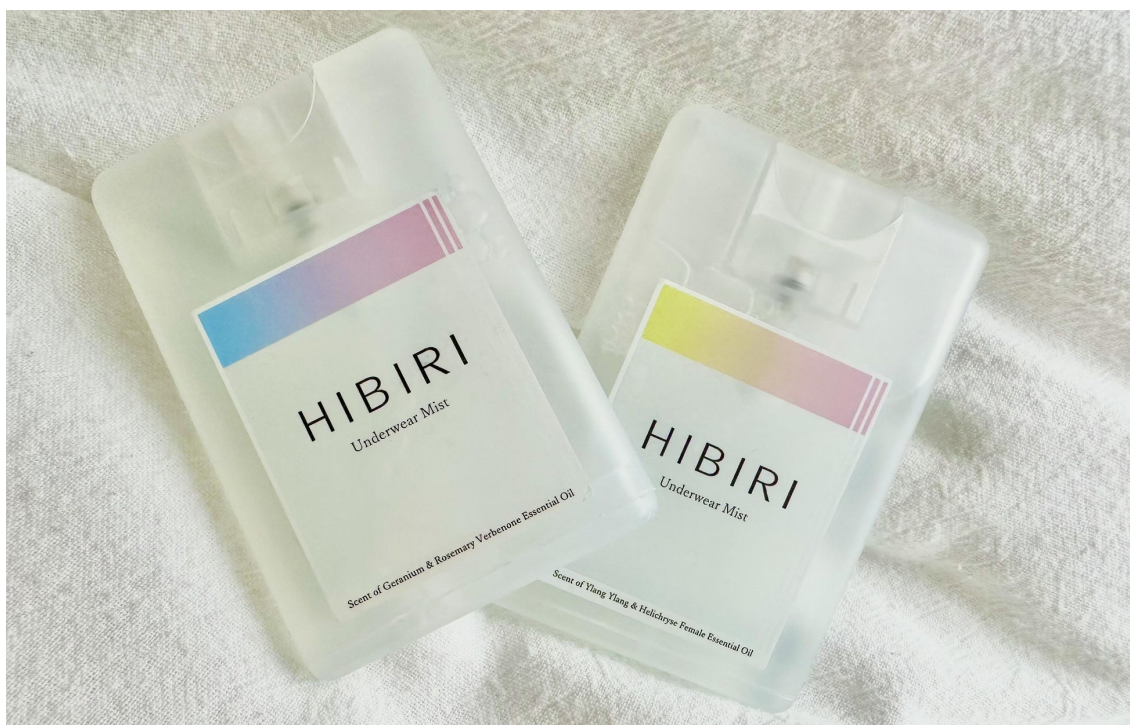
「HIBIRI」アンダーウェアミスト（左）ゼラニウム&ローズマリーベルベノン精油の香り（右）イランイラン&ヘリクリサムフェメール精油の香り

20代・30代の女性を中心に行った事前のモニター調査では、「カード型でコンパクトなので持ち運びに便利、気になった時に使える」「仕事の性質上、おりものシートを頻繁に替えられないので良い」などと好評を受けました。