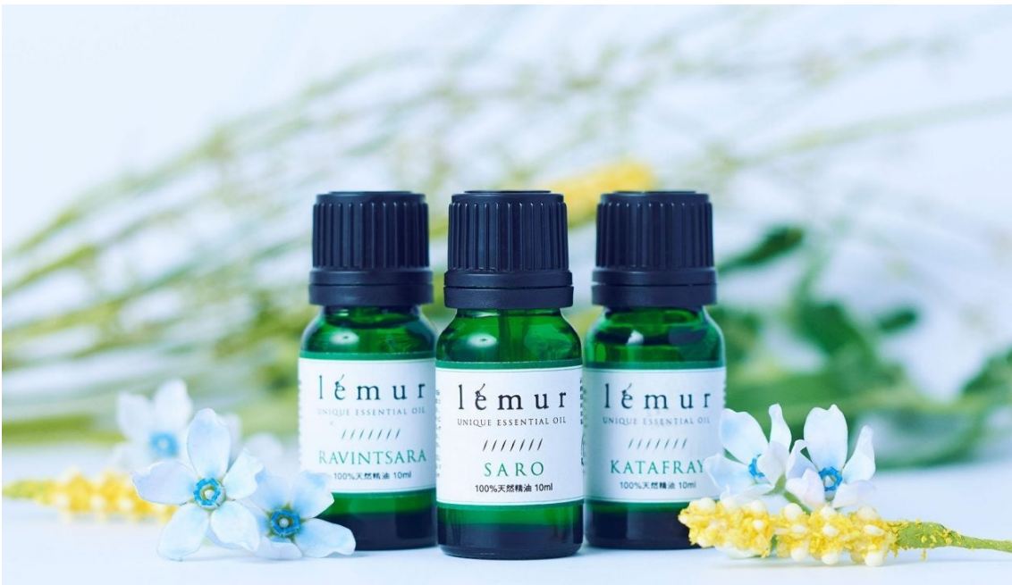
マダガスカル産の天然精油を活用。

また、アフリカ・マダガスカルの高品質なエッセンシャルオイル（精油）を使用。「ゼラニウム＆ローズマリーベルベノン精油の香り」「イランイラン＆ヘリクリサムフィメール精油の香り」の2種類から選べます。