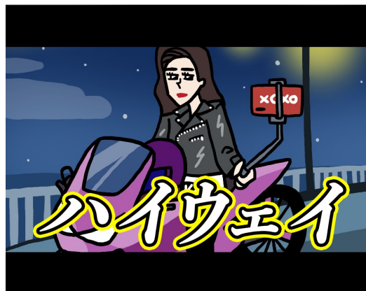
ハイウェイから相談にのるおしゃクソ姉さん