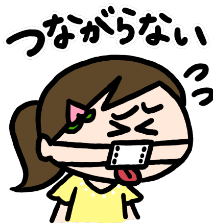
電話が繋がらないと嘆くモモちゃん