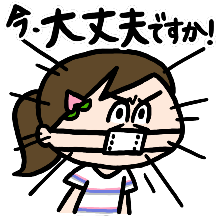
様子を伺うモモちゃん