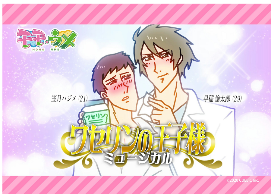
モモちゃんが推し活する「ワセリンの王子様」