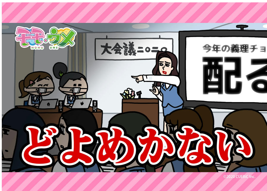
会議を制するおしゃクソ姉さん