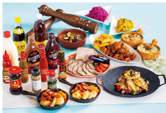
バイキング&amp;buffet イメージ

内容：味を”変（か）える”をテーマに、多彩なソースやトッピングで味わいの変化を何度でも愉しめる体験型メニューが登場します。