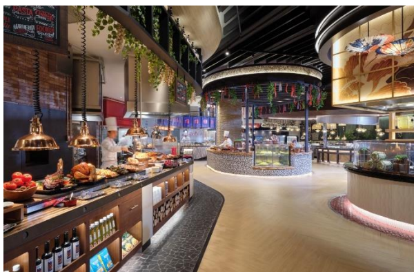
写真上：シェフズキッチン

また、7月から8月にかけてインスパイアのメインロビーにある「ホライゾンラウンジ」では、夏の暑さを忘れさせてくれる、インスパイア特製の韓国かき氷（ピンス）4種類をご用意しています。ホテルサンタワー内の「サンラウンジ」とビュッフェ「シェフズ・キッチン」では、夏の旬の食材を使った特別なデザートとドリンクを提供します。