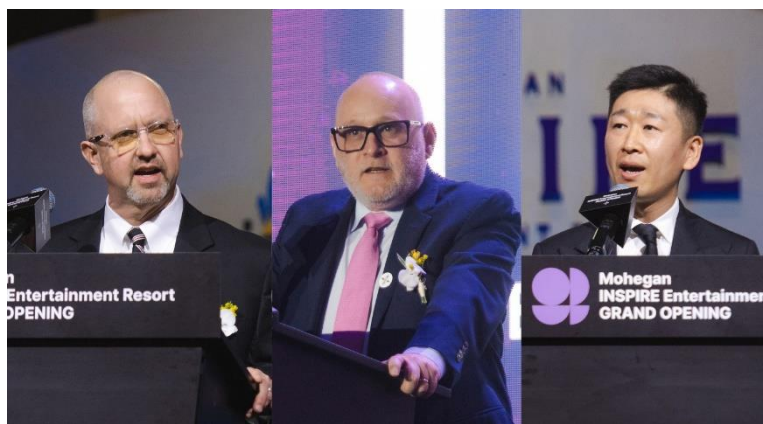
写真左：ロタンダで開催されたグランドオープンセレモニーの様子