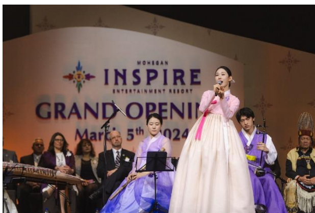
写真左上：「スマッジセレモニー」の様子