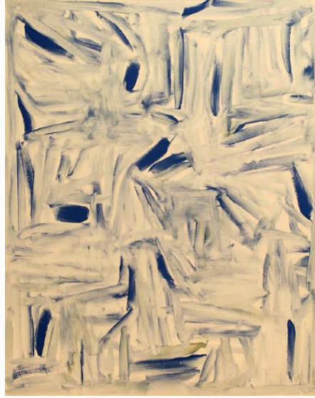
李禹煥《With Winds》1995年 高橋龍太郎コレクション ©Lee Ufan