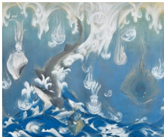
【左】草間彌生《海底》1983年、高橋龍太郎コレクション 画像転載不可