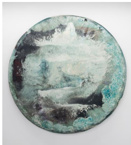
目 [mé]《アクリルガス T-1#19》 2019年、高橋龍太郎コレクション