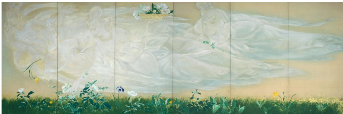
川端龍子《花摘雲》1940年、大田区立龍子記念館蔵