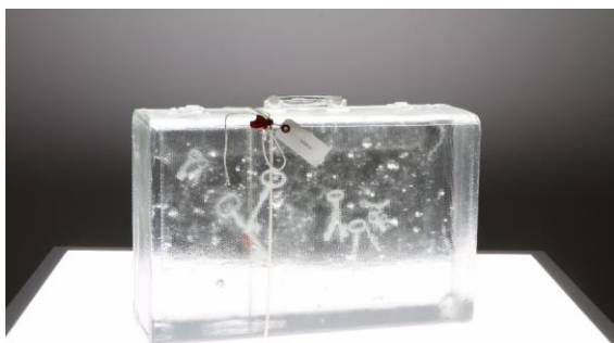
宮永愛子《suitcase -key-》2013年、 高橋龍太郎コレクション