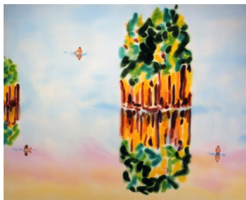
丸山直文《Island of Mirror》2003年、 高橋龍太郎コレクション Copyright the artist, Courtesy of ShugoArts, Photo by Shigeo Muto