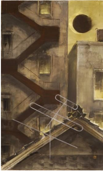
川端龍子《日々日蝕》1958年 大田区立龍子記念館