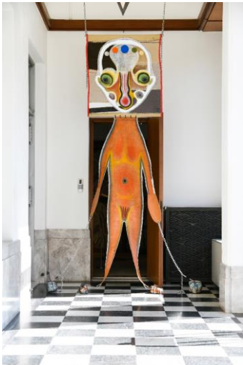
加藤泉《Untitled》2020年 高橋龍太郎コレクション 展示風景（東京都庭園美術館、2020年） ©2020-Izumi-Kato