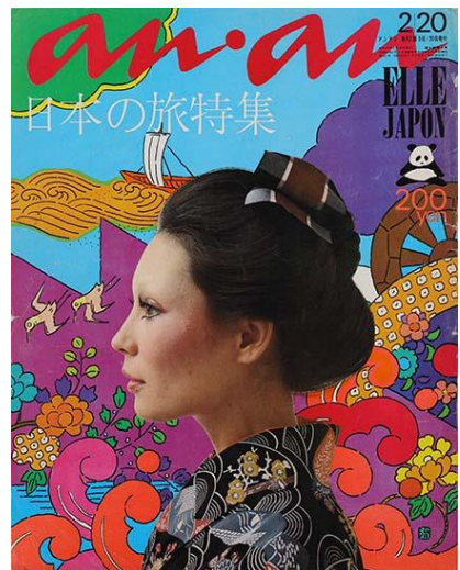
「an・an」第47号 1972年 平凡出版 アートディレクション：堀内誠一 表紙イラストレーション：原田治

すでに画才を発揮していた小学校時代のスケッチブックや、イラストレーターとしてデビューするきっかけになったニューヨーク滞在時の作品など、初公開資料も多数展示します。