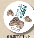
邪鬼缶マグネット