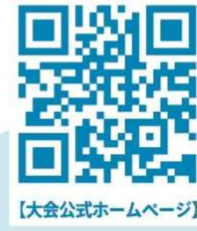
[大会公式ホームページ]

■主催 ANA ウィンドサーフィンワールドカップ横須賀・三浦大会実行委員会 ■お問い合わせ 046-822-9284(横須賀市文化スポーツ観光部企画課内) 詳しくはホームページをご確認ください。 https://windsurfing-wc.jp