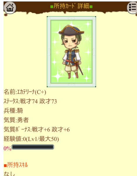
▲世界の偉人が国づくりをサポート！

引き続きケイブでは、魅力あるコンテンツをより多くの方に、より上質にお届けできるよう、スマートフォンサービスを充実させていきます。