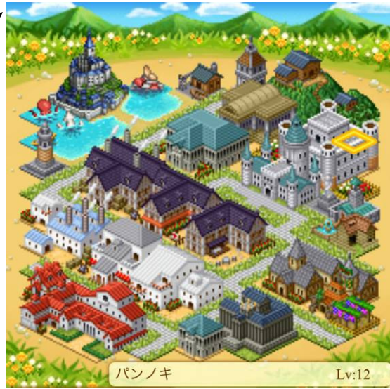
▲スマートフォン版箱庭画面