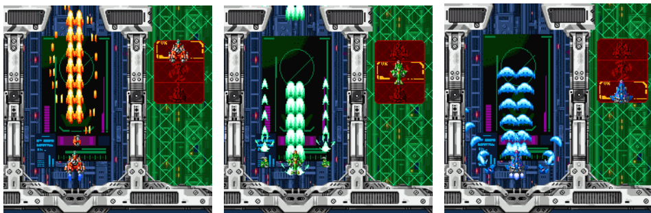
各機体とショットパターン

各パターンによって獲得スコアが変動します。状況に応じた攻撃パターンを模索し、ハイスコアを更新していく楽しみが大変魅力的な要素となっております。