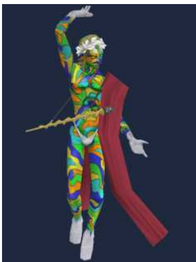
「破壊神・ディオニュソス」