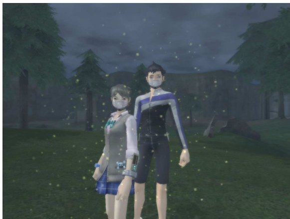
▲花粉装備で周囲から熱い視線が……