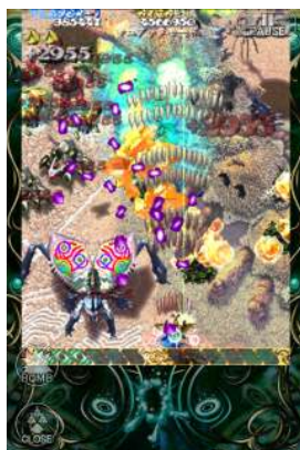
マニアックモード