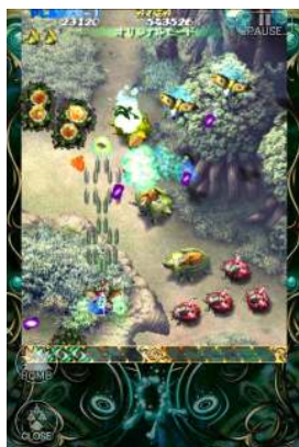
オリジナルモード

弾数少なめの【オリジナル】モードから弾幕数 MAX の【ウルトラ】モードまでの3種類のゲームモードを用意！更に、【NOVICE】【NORMAL】【HARD】【HELL】の4種類の難易度選択が可能で、シューティングゲーム初心者からコアなシューティングゲームユーザーまで誰でも『虫姫さま』の世界を楽しむ事ができます。