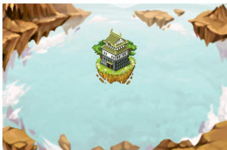
限定城外観「天空城」と限定風景「空島」

さらに W チャンスとして、3 口、5 口、10 口、15 口ごとに武将像の設計図がもれなくもらえます。