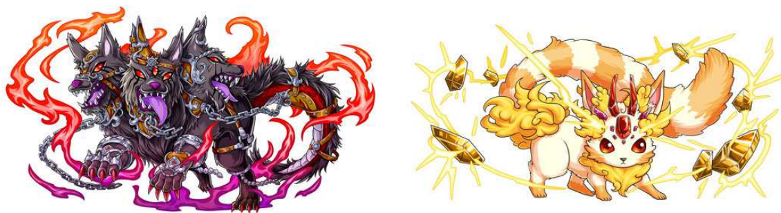
< 幻獣の一例 >