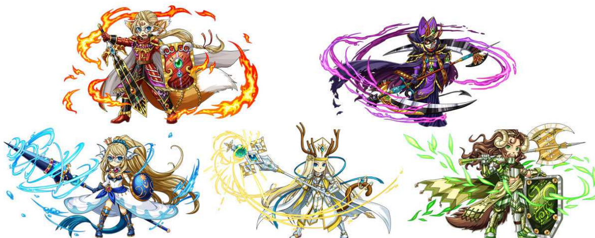
< 進化した 5 属性マスターたち >

攻撃タイプの頼もしい味方、「火」「水」「木」「光」「闇」5属性のマスター達が第3進化！ リーダースキルも攻撃力 1.2 倍から 1.5 倍にパワーアップ！