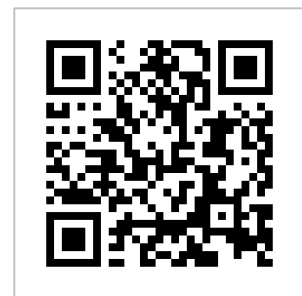
『富士山に登ろう！』QRコード

まだ富士登山を経験したことがない方も、経験者の方も、どちらの方にもお楽しみ頂けます。