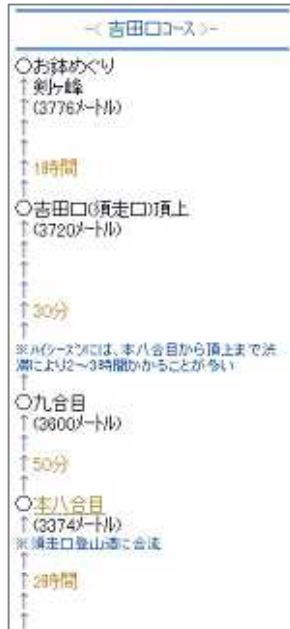
富士登山ルートマップ