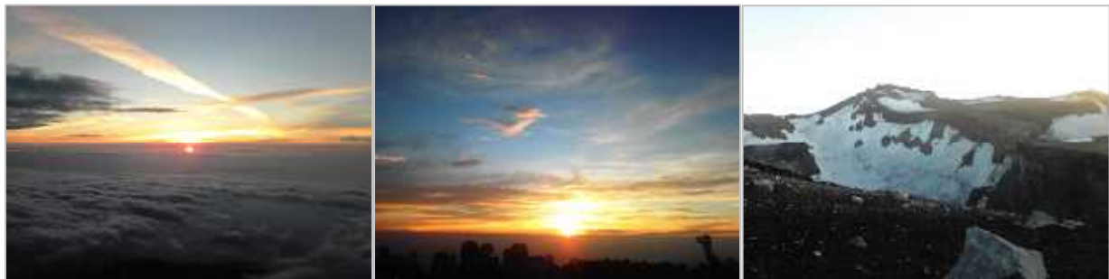
富士山から見た景色

オンラインエンターテインメント事業を展開する株式会社ケイブ(本社:東京都新宿区、大証ヘラクレスコード:3760)では、携帯電話向けサービスとして配信中の『山と溪谷モバイル』(株式会社山と溪谷社監修)におきまして、7月1日(水)より、富士登山に役立つ情報が満載の特集『富士山に登ろう！2009』を配信いたします。