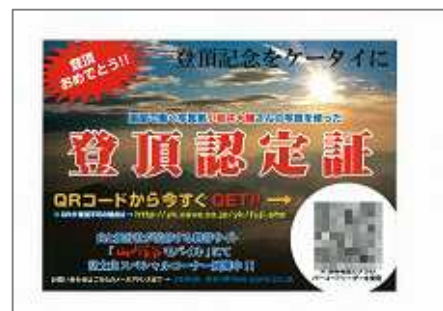
『登頂認定証』が入手できる案内ボード

“日本一”を称する富士山だからこそ、登った証が欲しい！と思う方も多いのでは？そんな方にぜひ手に入れていただきたいのが、『登頂記念認定証』。携帯電話から、山頂にある山小屋「扇屋」に設置された QR コード(右図)にアクセスすることで、「日付入りオリジナル登頂記念証」をダウンロードすることができます。どんな画像が手に入るのかは、富士を制した方だけのお楽しみ！