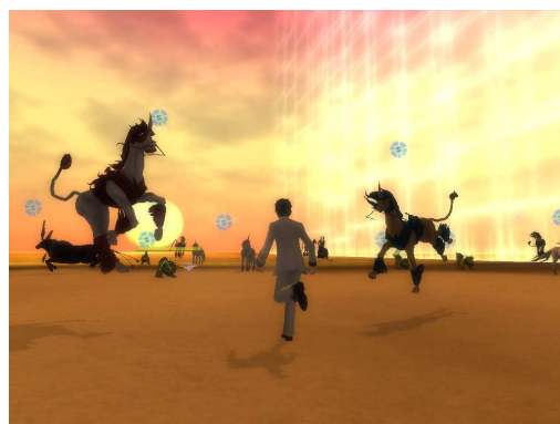
▲夕日に向かって走ると酷い目に…