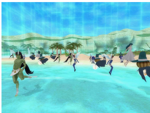
▲見慣れたビーチがとんでもない事に!