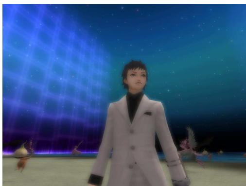
▲満点の星空ですが、狙われています