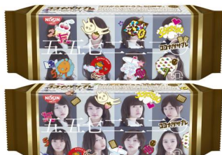
五五七二三二〇バージョン2種

2015年3月20日(金)よりココナッツサブレ五五七二三二〇コラボパッケージの発売を開始します。先行して発売している私立恵比寿中学の限定パッケージ4種に加えて、『五五七二三二〇』バージョンの限定パッケージ2種を新たに発売いたします。