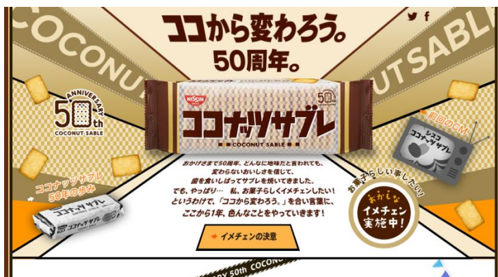
50周年スペシャルサイト

2015年3月19日(木)より、ココナッツサブレ50周年キャンペーンのコミュニケーションプラットフォームとして、1年間に渡って「おかしなイメチェン」の情報をタイムリーに発信していきます。