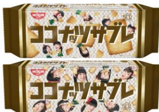
私立恵比寿中学バージョン4種