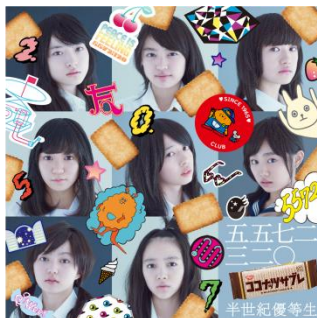
半世紀優等生ジャケット写真