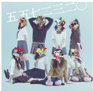
五五七二三二〇アーティスト写真

2015年3月20日(金)にソニー・ミュージックレーベルズより正式デビュー。ココナッツサブレ50周年を記念して結成された、期間限定ユニットのパフォーマンスユニット。高い演奏技術と超重厚系な音楽が売りで、KenKen (RIZE)が楽曲提供するデビュー曲『半世紀優等生』では、10代特有のコンプレックスや自己変革に対する欲求と、50年に渡る優等生的存在からの脱却を狙うココナッツサブレの想いを歌に込めながら、ギター5名+ドラム3名という超変則体制で攻撃的かつ挑発的なパフォーマンスを披露する。