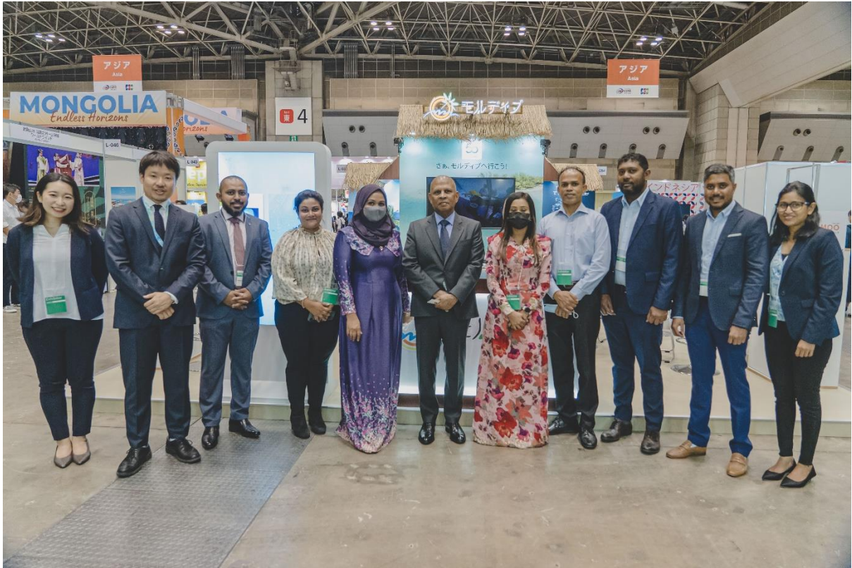
昨年開催時の様子

モルディブ政府観光局は「ツーリズム EXPO ジャパン 2023」出展を通し、日本の旅行業界関係者および一般消費者の皆様へ直接情報をお届けすることにより、今後も積極的な観光誘致を図ってまいります。