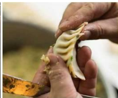
ひだの数までこだわり、一つ一つ特製の皮で包み込みます。