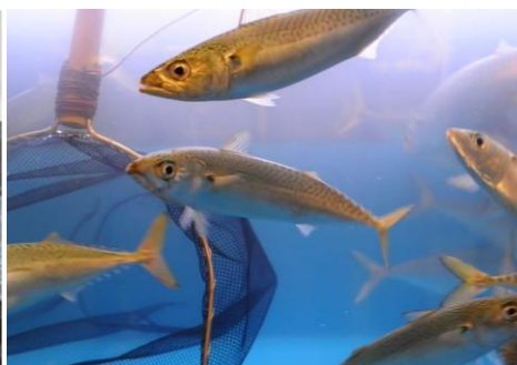
熱中屋各店へ配送。優しく運ばれたサバは水槽の中でも元気良く泳ぎ回ります。