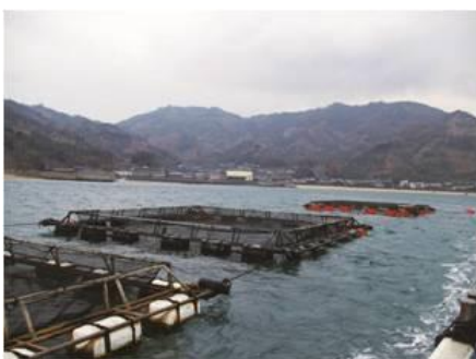
大分県と愛媛県の間「中島」という場所で稚魚から大切に育てた豊後さばは、約3年間で出荷されます。