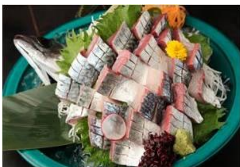
活豊後さば刺し 1尾 3,980円/半尾 1,980円

関東ではほとんど目にすることがない幻の逸品「活さば刺し」。大分県豊後水道の荒波にもまれ、身の締まり、脂ののり共に超一級品のさばを大分から活魚車で丁寧丁寧に搬送し、お客様のご注文をいただいてから生簀より引き上げいたします。脂ののったトロトロの腹側の身と、ギュっとなったコリコリの背側の歯ごたえは、新鮮だからこそその味わいです。ぜひ実感してください。