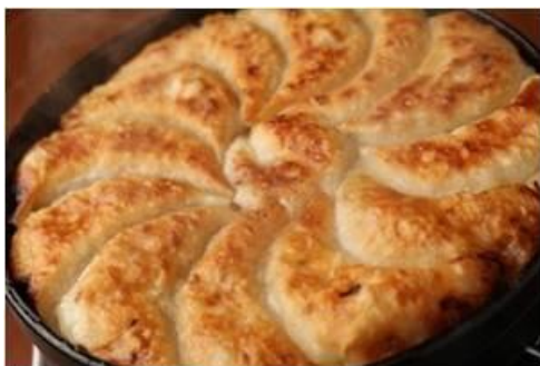
博多一口鉄板餃子 1,000円

豚の腕挽肉を粘りが出るまで丁寧に良くまぜ、食感、ジューシー感にこだわり、2種類の挽肉を使用。それぞれのお店で一つ一つ包みこみ、握りたてを焼きあげるこだわりの自家製餃子です。