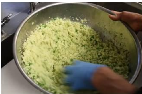
自慢の餡は、こだわりの素材を各店舗で混ぜ込んでいます。