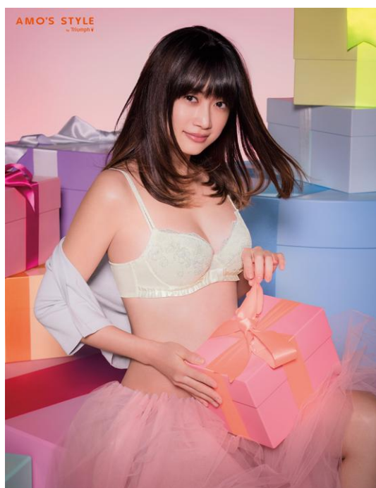
〈ヨンアコラボ〉 AMST1818 シリーズ2 ブラジャー&ショーツ モデル: 2016年 AMO'S STYLE by Triumph イメージキャラクター ヨンア

“一人ひとりの自信を高める会社” トリンプ・インターナショナル・ジャパン株式会社(本社:東京都中央区築地5-6-4、代表取締役社長:土居健人)の直営店「AMO'S STYLE by Triumph (アモスタイル バイ トリンプ)」では、昨年初登場し大好評を博した、2016年 AMO'S STYLE by Triumph イメージキャラクターを務めるモデルのヨンアさんとのコラボシリーズを今年も展開。クリスマスシーズンに向けて新作2シリーズを2016年10月27日(木)より順次新発売します。