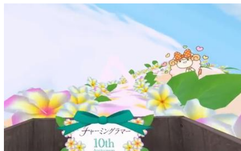
※「ふっくら谷間コースター」体験イメージ