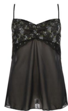
ロングキャミソール