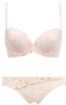
ブラジャー&ショーツセット