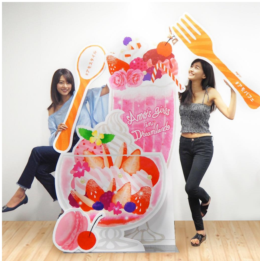
「AMO'S Instagenic Booth」