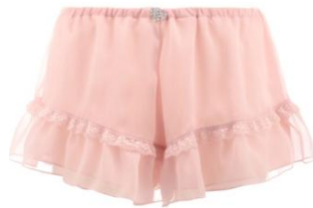
フレンチパンティ

撮影した写真にハッシュタグを付けてInstagramに投稿して頂いた方を対象にプレゼント。