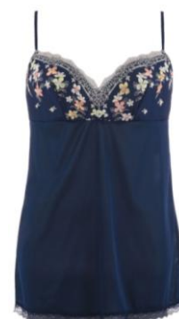
ロングキャミソール