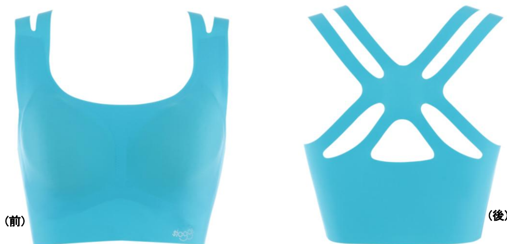
『スロギー ZERO FEEL ® 』 アクティブタイプ ハーフトップブラ(ノンワイヤー)