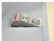
インナーラベル(イメージ)