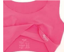
ラベルは裏生地にプリント

『スロギー ZERO FEEL ® 』は、1年を通じて、様々なシーンで快適に過ごせます。