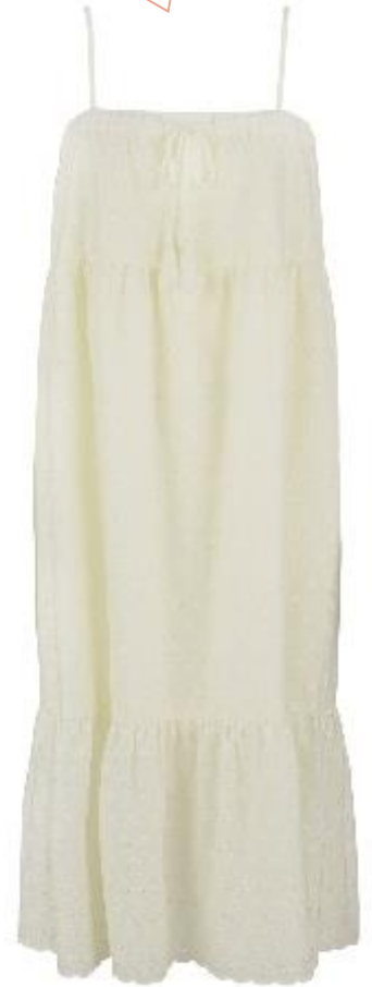
ルームワンピース