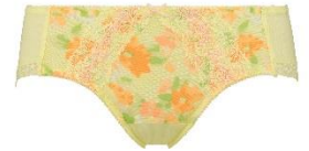
サニタリーショーツ