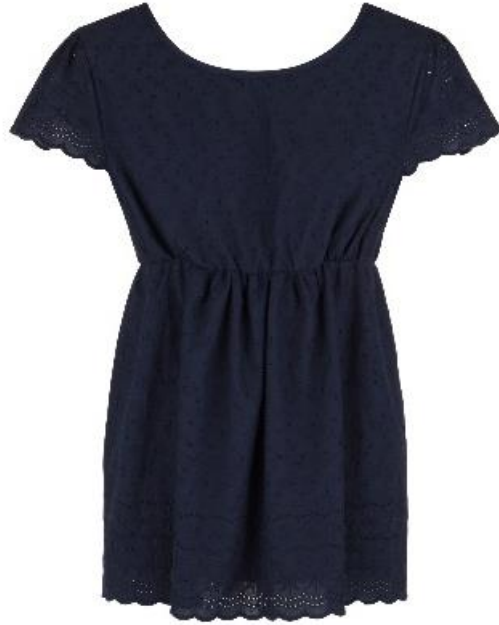
フレンチ袖トップ