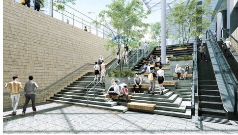
▲サンクン階段パース