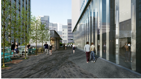
▲「ペデストリアンデッキ」パース

「田町タワーモール」では、駅前空間に準じたゆったりとした滞留スペースを用意し、休日にはイベントなども開催することにより、より賑わいのある田町駅周辺の発展を目指します。