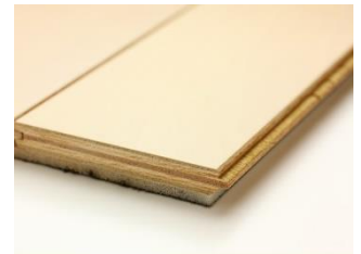
(複合フローリング)

集成材や合板に木目柄をプリントしたシートや薄くスライスした天然木を貼って仕上げたフローリングのため、木の温もりを感じにくいです。無垢材に比べると初期費用は安いですが、湿気などによりべたつきやすく、傷も目立ちます。また、傷むと張替えが必要となり、その分の費用が掛かってしまいます。