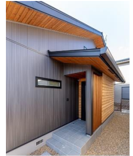
(外壁：金属サイディング)

外壁材を選び際は、初期費用＋維持管理コストまで含めたトータルコストで考えましょう。