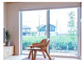
(高性能の窓：樹脂サッシ)

暑い時季や寒い時季に、家を快適な室温に保とうとすると、エアコンなどのエネルギーが掛かります。しかし、窓の性能が低ければ低い程、熱や冷気を通しやすくなってしまいうため、エアコンで室温を保たなければなりません。それが増エネになり、光熱費が増加してしまいます。家の快適性を考えると、窓は断熱性の弱点になるため、高断熱性の窓を選ぶようにしましょう。そうすれば、光熱費を削減でき、トータルコストではむしろお得になります。