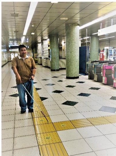
実証実験イメージ