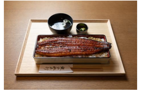
一本のせ山椒ざんまい鰻重 4,290 円 (税込)