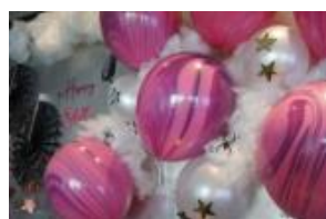
ピンクバイオレット

美しいマーブル模様が描かれた風船。ファンタジー、レッドオレンジ、イエローオレンジ、グリーン、ピンクバイオレット、ブルー、ブラック&ホワイトの全7種類です。色の使い次第で、ちょっと変わったアレンジのハロウィーンを演出できます。