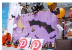
イエスタ ハロウィーン 逆さコウモリ デコレーションイメージ