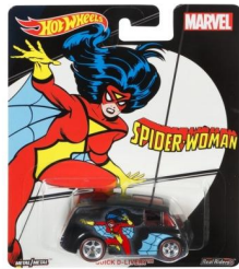
QUICK D-LIVERY™ (SPIDER-WOMAN) クイック・デリバリー (スパイダー・ウーマン)