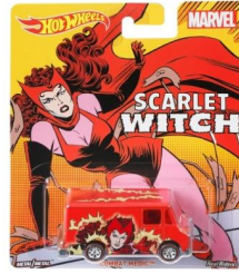
COMBAT MEDIC™ (SCARLET WITCH) コンバット・メディック (スカーレット・ウィッチ)