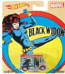
BREAD BOX™ (BLACK WIDOW) ブレッド・ボックス (ブラック・ウイドウ)