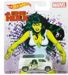
CUSTOM '77 DODGE VAN (SHE-HULK) カスタム'77ダッジ・バン (シー・ハルク)