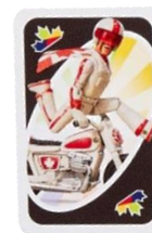
ワイルド・デューク・カブーン