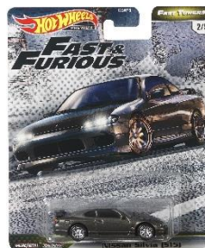
ニッサン・シルビア(S15)