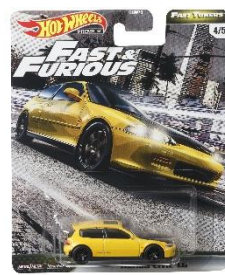
ホンダ・シビック EG