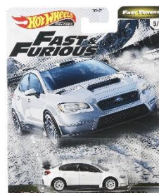
2016 スバル WRX STI