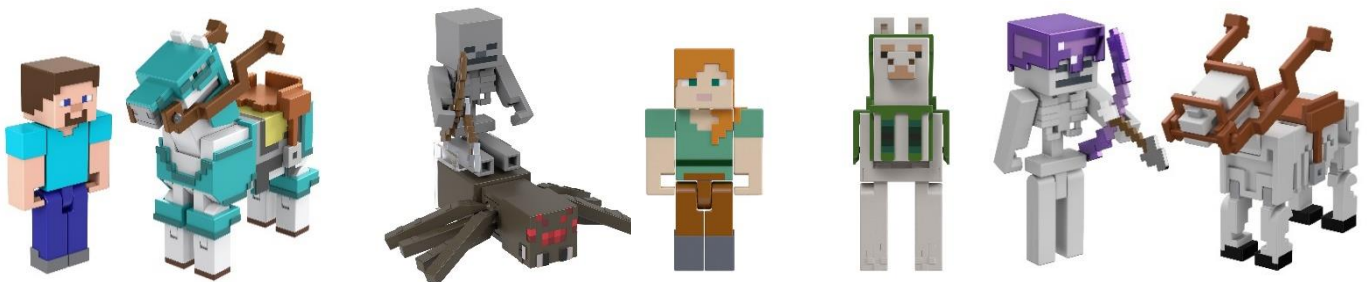
鎧を装備した馬とスティーブ

マイクラフトの世界観に沿った 2体セットのフィギュアです。ゲームからそのまま飛び出してきたような姿で、武器や防具などのアクセサリも忠実に再現しています。