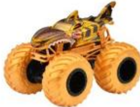
シャーク・レック