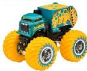
ウィル・トラッシュ・イット・オール