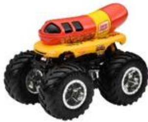
オスカーマイヤー・ウィンナーモービル