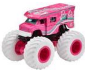
バービー - アルティメイト ・キャンパー