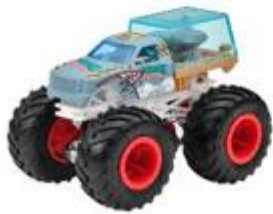
クラッシュ・デリバリー