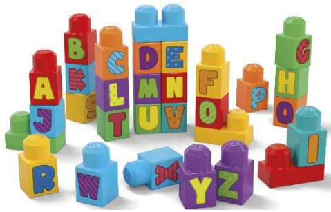
ブロック遊びをしながら英語が学べる！