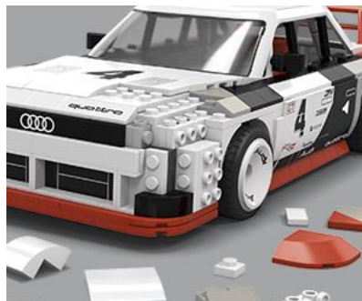
組み立てからディスプレイまで楽しめる