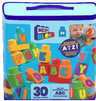
片付けに便利なバッグと持ち運びに便利な取っ手付き