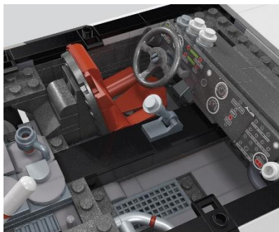
本格的でリアルすぎる内装と外装！

1:18スケールの「アウディ '90 クワトロ IMSA GTO」を精巧に再現できるブロックセットです。洗練された精巧なエンジン、太いレーシングタイヤ、複雑な配管を含むリアルなインテリアなど、コレクターを魅了する本格的なデザインと象徴的なグラフィックや装備を備えたシリーズです。ドアやボンネットは開閉でき、組み立てた後もディスプレイして楽しめます。同モデルのダイキャストカーが付いています。