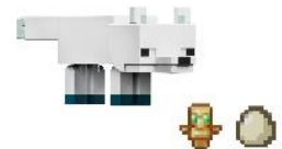
ホッキョクギツネ(HTN13)