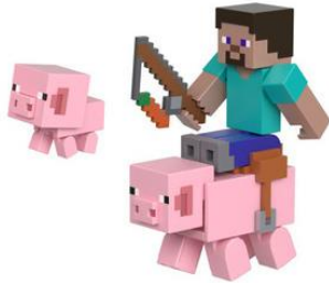
スティーブとブタ(HTL88)

マイクラフトの世界観に沿ったフィギュアの 2 体セットです。赤ちゃんブタ付きのスティーブとブタのセット、ゲームシーンを再現できるスイカと砂糖のアイテムが付いたサニーとラバのセット、石の剣とネザースターの付いたウィザーとウィザースケルトンのセットの 3 商品の展開になっています。