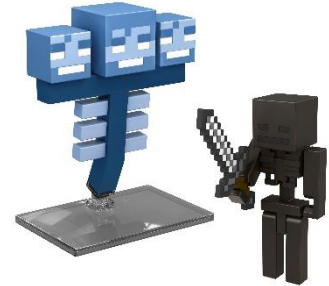
ウィザーとウィザースケルトン(HTL91)