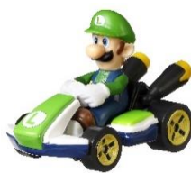
ルイージ (スタンダード・カート)