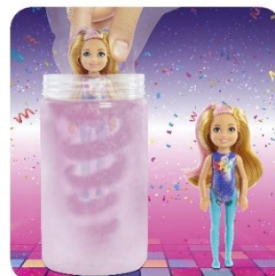
※画像はチェルシーです